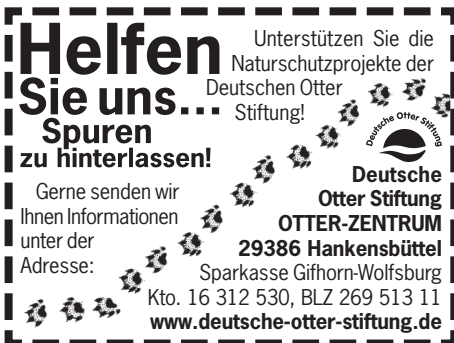
60mm x 45mm