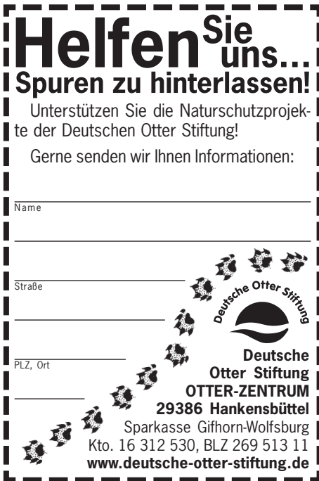
60mm x 90mm