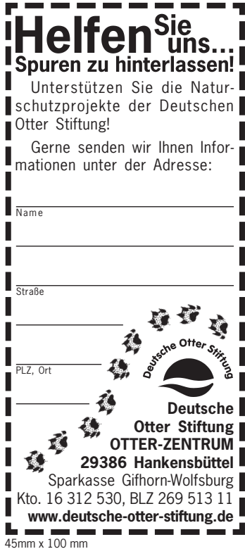
45mm x 100 mm