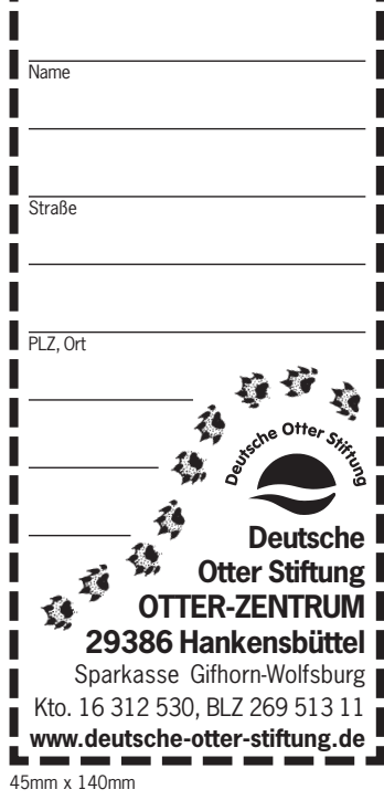
45mm x 140mm