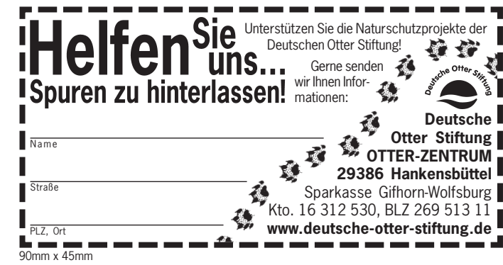
90mm x 45mm