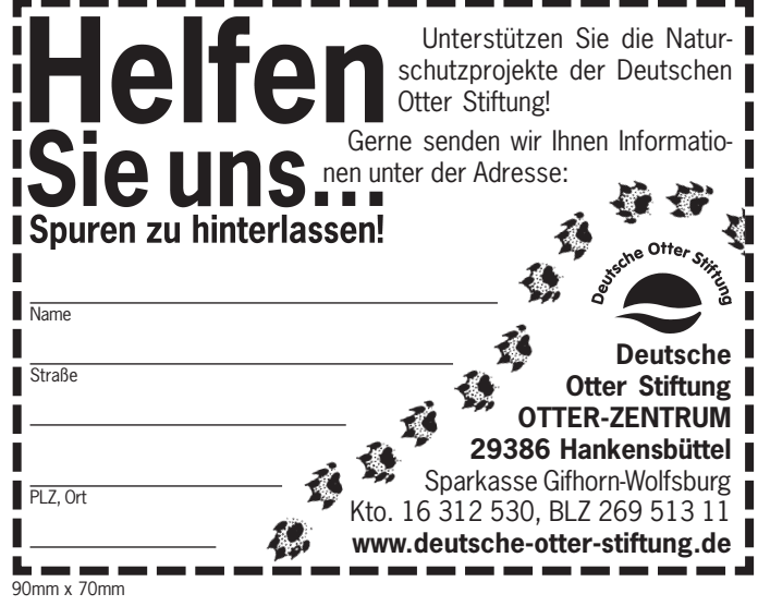
90mm x 70mm