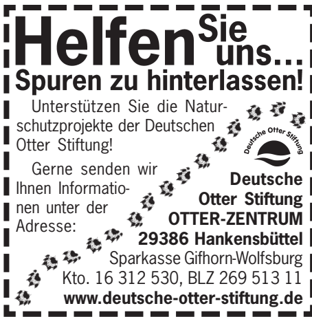
60mm x 60mm