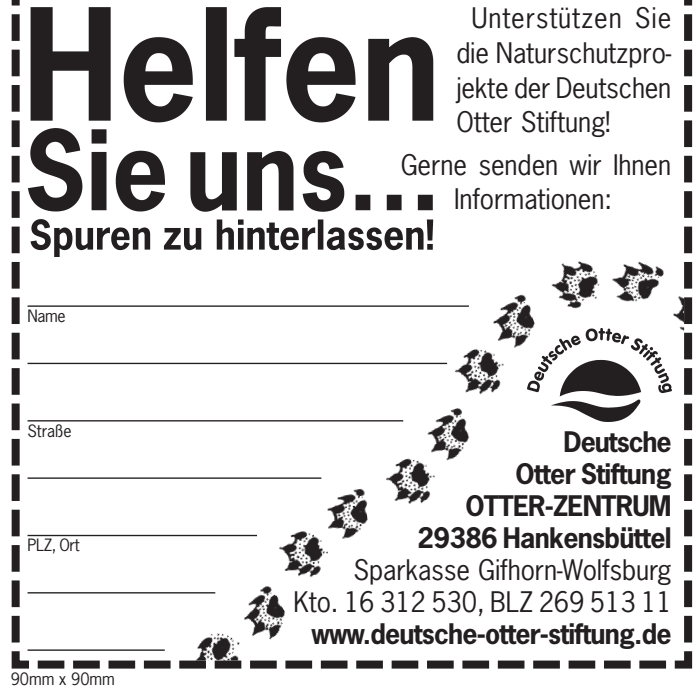
90mm x 90mm